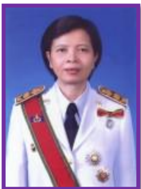
นางณิษฐา แสงทอง รองผู้ว่าราชการจังหวัดราชบุรี ดำรงตำแหน่ง เมื่อวันที่ 26 ตุลาคม พ.ศ.2558