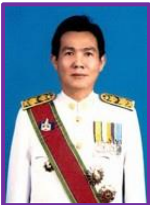
นายนิวัฒน์ รุ่งสาคร รองผู้ว่าราชการจังหวัดราชบุรี ดำรงตำแหน่ง เมื่อวันที่ 10 ตุลาคม พ.ศ.2559