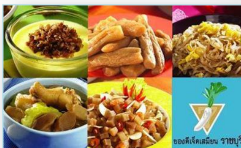
ของดีเจ็ดเสมียน ราชบุรี