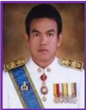
นายวิรัตน์ ประเสริฐ รองผู้ว่าราชการจังหวัดราชบุรี ดำรงตำแหน่ง เมื่อวันที่ 21 พฤศจิกายน พ.ศ.2559